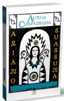
Auto da Compadecida Autor: Ariano Suassuna Editora Nova Fronteira