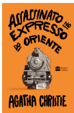
Assassinato no Expresso Oriente Autor: Agatha Cristie Editora Harper Collins