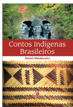
Contos Indígenas Brasileiros Autor: Daniel Munduruku Editora Global